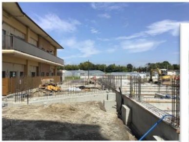
↑ 別館への渡り廊下